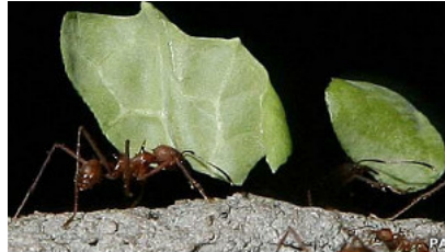
Se espera que esa investigación se extienda a otras especies.

"Actualmente hay químicos con los que se fumiga para controlar la plaga, pero estos también exterminan a los competidores naturales de las hormigas rojas", explica para BBC Mundo el Doctor Yannick Wurm.